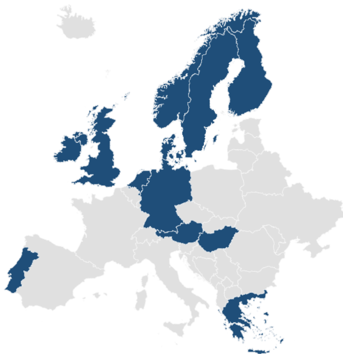
Figur 3-1 Europeiske land som har innført frivillige avtaler.

Norge var et av de første landene i Europa til å iverksette en frivillig avtale om reduksjon av matsvinn, en modell først utviklet i UK og senere adoptert av flere andre europeiske land (Szulecka & Strøm-Andersen, 2022). I dag er det rundt 12 land som har innført frivillige avtaler for reduksjon og forebygging av matsvinn (Figur 3-1).